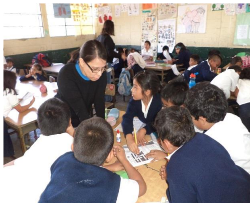
Niños de primaria reciben útiles escolares y hacen uso de ellos en el aula – Febrero 2015