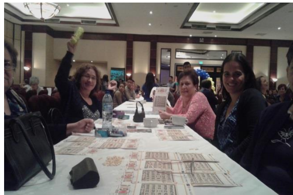
Fotos: Asistentes disfrutaron del juego de bingo realizado en noviembre de 2015.