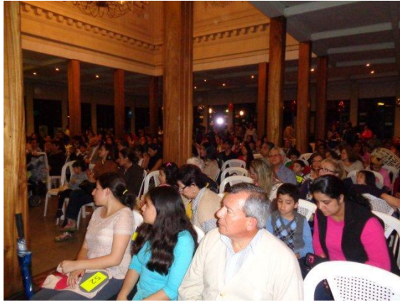
Fotografías: cuadros de pintura elaborados por niños y público asistente a la subasta – octubre 2015