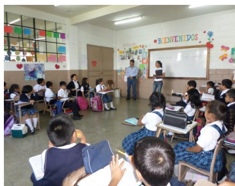
Actividades de voluntariado con becados y visitas de supervisión-monitoreo - marzo 2015