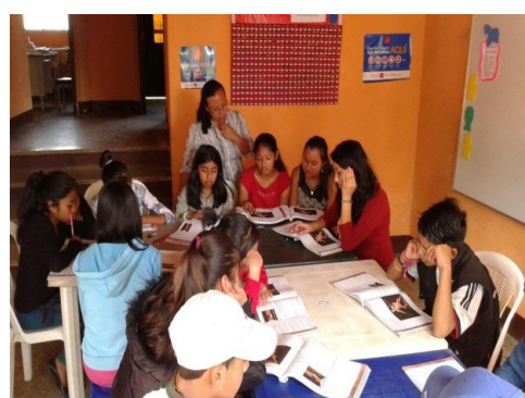
Estudiantes en clases de mejoramiento en matemática y lectoescritura – mayo 2015

BK Becas Fundación 31 calle 15-31 Zona 12, Ciudad de Guatemala PBX 2205-5555 extensión 114 - email fundación_bkbecas@yahoo.com www.bkbecas.org