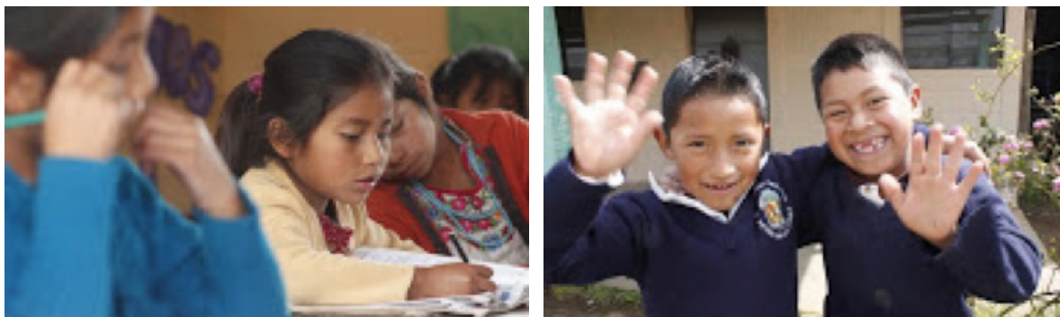
Fotografía: niños y niñas estudiantes beneficiados con el proyecto de becas de primaria – Escuela Rural Mixta Aldea Chipiacul, Municipio de Patzún, Chimaltenango – Septiembre 2014.

Este proyecto se trabaja en conjunto con seis instituciones educativas: Fe y Alegría y Colegio Benedictino (Guatemala); Asociación CDRO (Totonicapán); Asociación Renacimiento y Acuala Alaj Zum (Chimaltenango) y Asociación Corazón de los Niños (Sacatepéquez).