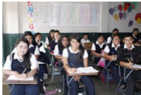
Fotografía: Estudiantes becados por el proyecto durante clase de computación y en su aula de estudios - Centros Fe y Alegría # 6 (Lo de Coy, Mixco) y # 2 (Carolingia, Guatemala) / Agosto 2014